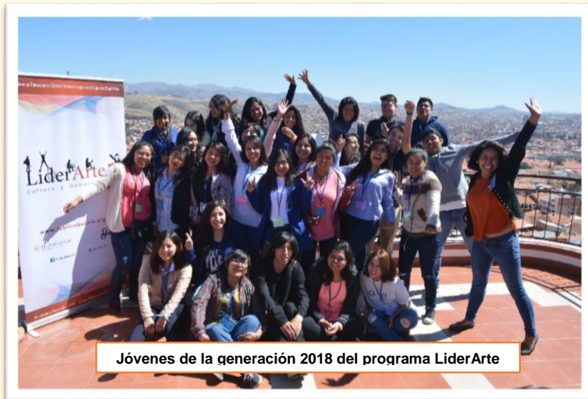
Jóvenes de la generación 2018 del programa LiderArte

Fundación Jubileo invita a jóvenes líderes de Bolivia a ser parte de la tercera versión del “Programa de Formación de Gestores Socioculturales – LiderArte”